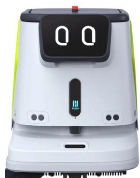
お掃除ロボット (株式会社HCI 様)