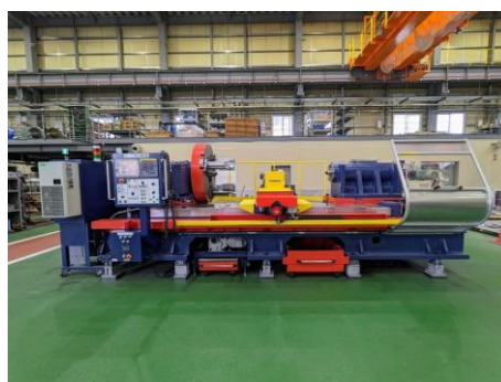
車両削正装置 (JR九州エンジニアリング株式会社 様)