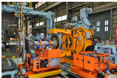
鉄道車両用輪軸プレス (コータキ精機株式会社 様)