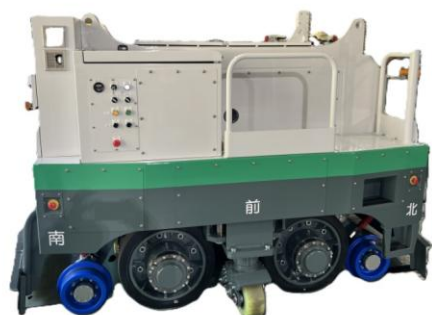
電動車両移動機 (F.B Bison株式会社 様)